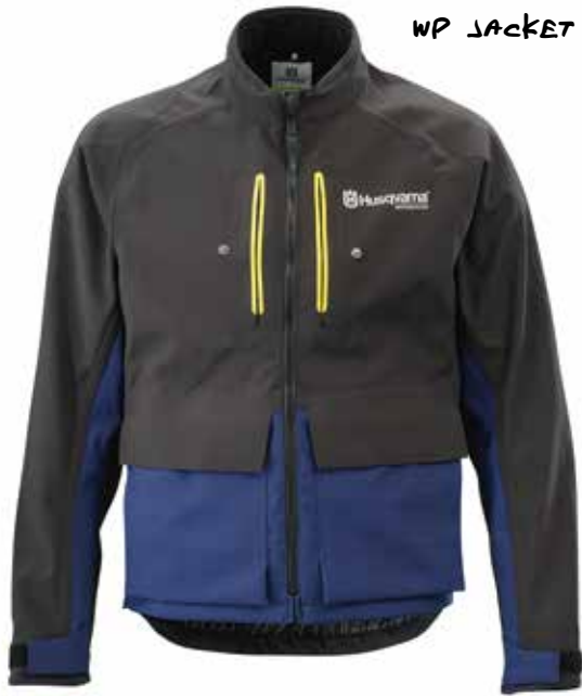
GOTLAND WP JACKET