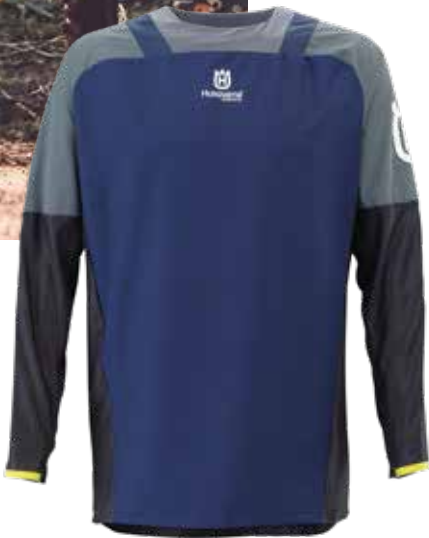
GOTLAND SHIRT BLUE