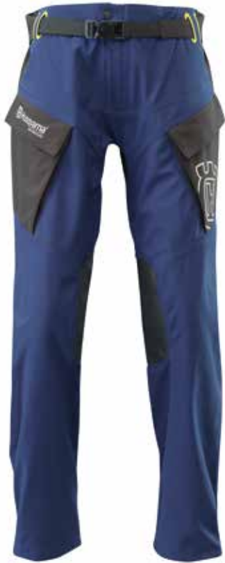
GOTLAND WP PANTS