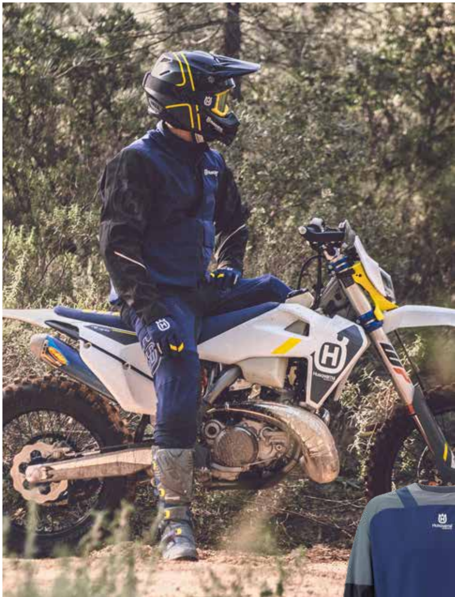
MOTO 9 MIPS GOTLAND HELMET ACCURI GOGGLES GOTLAND JACKET GOTLAND PANTS RIDEFIT GOTLAND GLOVES CROSSFIRE 3 SRS BOOTS