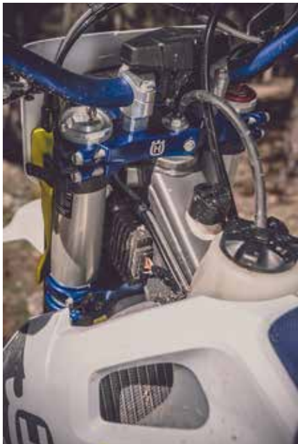
FACTORY TRIPLE CLAMP KIT