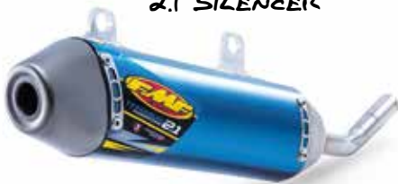
FMP TITANIUM POWERCORE 2.1 SILENCER